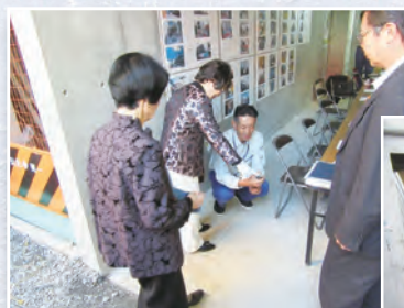
※前回開催時の様子