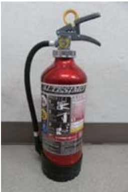
小川組に設置してある消火器 A B C 粉末消火器 10型

A (普通火災) B (油火災) C (電気火災) それぞれの火災に対応してるタイプです。